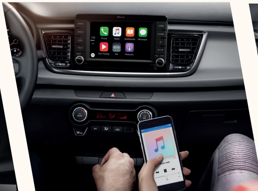
Sistema multimídia com tela de 7", conectividade com Apple CarPlay e Android Auto, bluetooth e controles no volante.