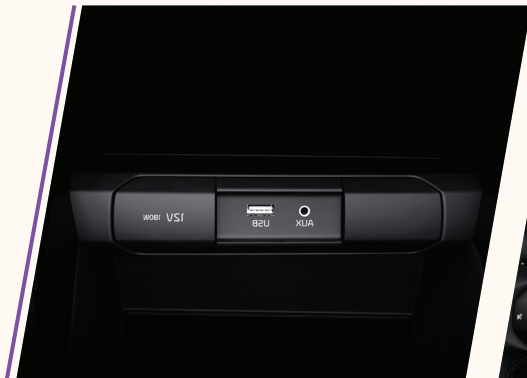
Console central com 1 porta USB para dados/energia, tomada 12V e Aux.