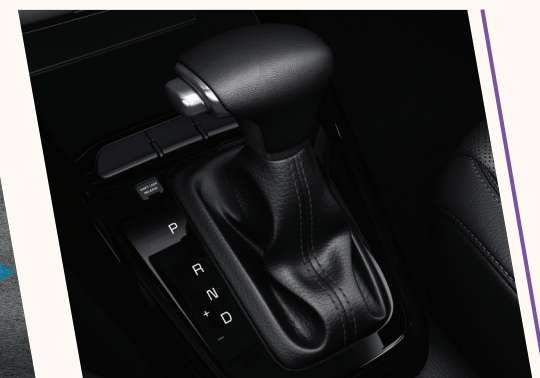
Transmissão automática de 6 velocidades, com opção de trocas sequenciais.

Imagens da versão R.255 - Ano 2020 Modelo 2021