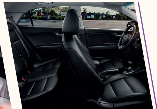
Bancos, volante e alavanca de transmissão revestidos em couro.