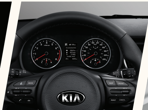
Volante multifuncional com controles do sistema de entretenimento, comando de voz e piloto automático.