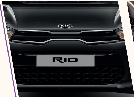
Grade "Nariz de Tigre".