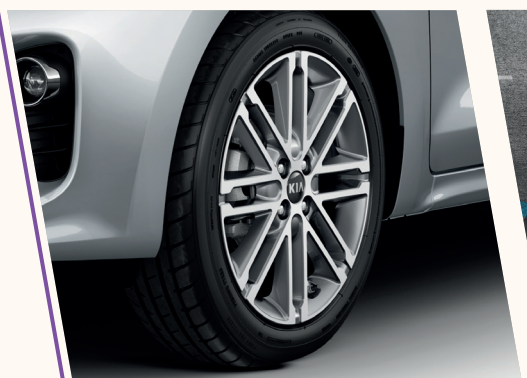
Rodas de liga leve 17".