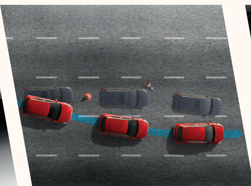
Controle de Estabilidade - ESC, Controle de Tração - TCS, Controle de Freagem em Curvas - CBC e Assistente de Partida em Rampa - HAC.