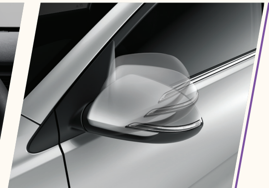
Espelhos retrovisores externos com rebatimento, regulagem elétrica, setas integradas e aquecimento.